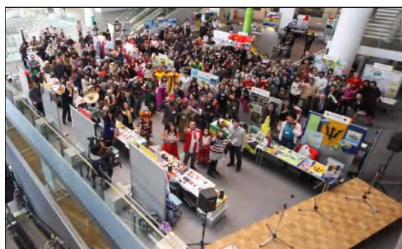
2013ワン・ワールド・フェスタinいわて

また、両事業とも、アイーナ以外に各地域でも開催することにより、国際交流の啓発普及を進めている。