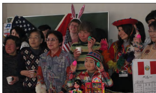
外国人との交流会「ちゃっとランド」 (奥州市江刺区)