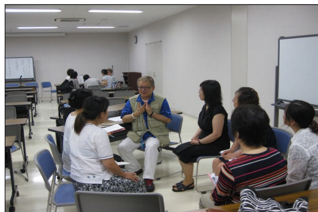
分野別多言語サポーター通訳研修会