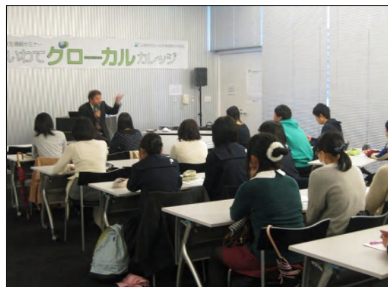
いわてグローバルカレッジ