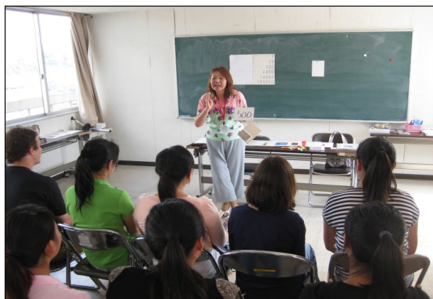
日本語サポーター実践者研修会