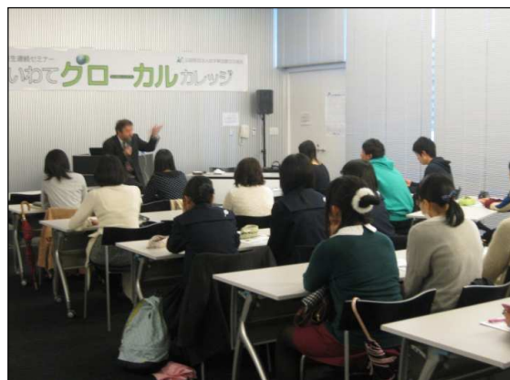
いわてグローバルカレッジ