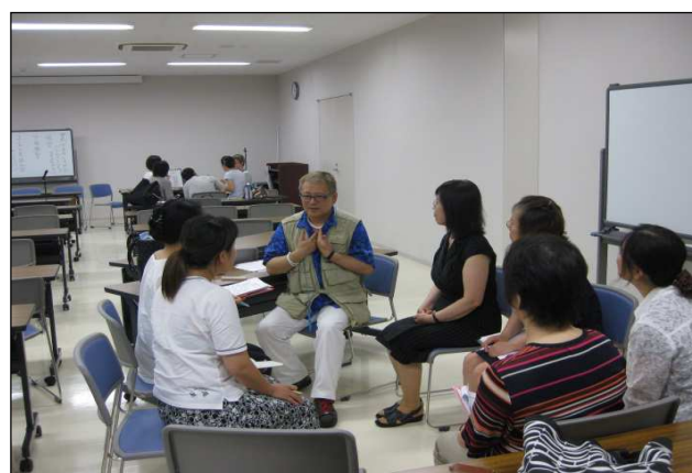
分野別多言語サポーター通訳研修会