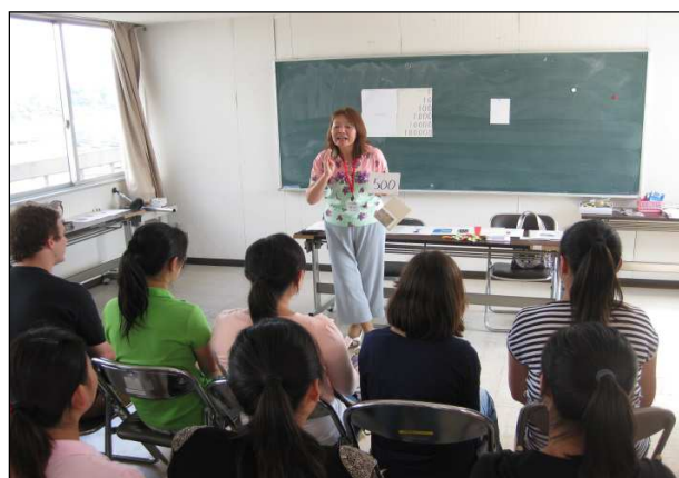
日本語サポーター実践者研修会