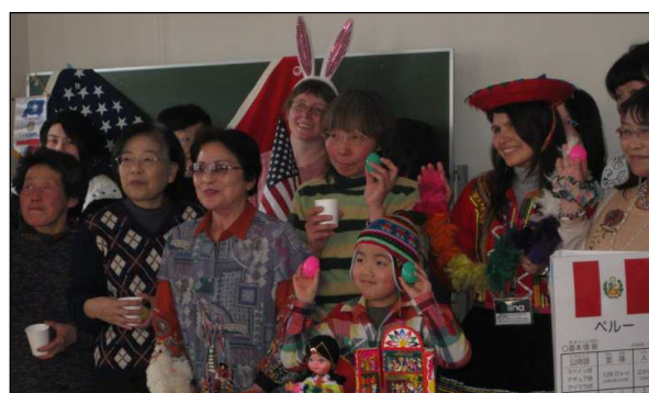
外国人との交流会「ちゃっとランド」 (奥州市江刺区)