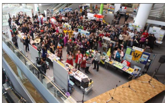
2013ワン・ワールド・フェスタinいわて

また、両事業とも、アイーナ以外に各地域でも開催することにより、国際交流の啓発普及を進めている。