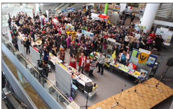
2013ワン・ワールド・フェスタinいわて

また、両事業とも、アイーナ以外に各地域でも開催することにより、国際交流の啓発普及を進めている。