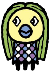
< Amabie >