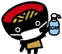
< Sobacchi (ver. de lavado de mano) >