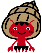
< Nemarō-kun >

Continúen evitando ir a instalaciones o negocios (que no han colocado las medidas preventivas), sitios donde se han reportado casos de conglomerados en otras regiones y también a lugares donde "Las 3 Cs" (Espacios cerrados, áreas abarrotadas y contacto cercano) son inevitables.