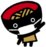
< Sobacchi (ver. de mascarilla.) >