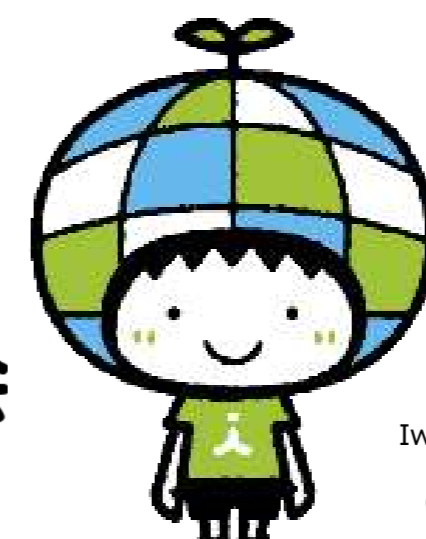
Ahsun Iwate International Association Original Mascot

公益財団法人 岩手県国際交流協会 Iwate International Association