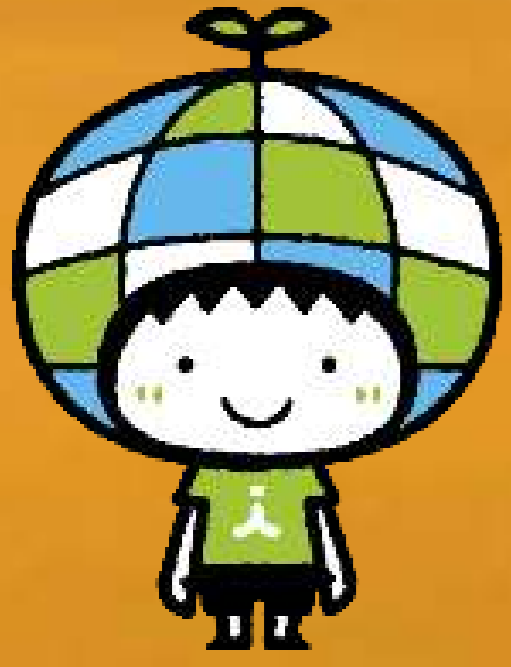
Ahsun Iwate International Association Original Mascot