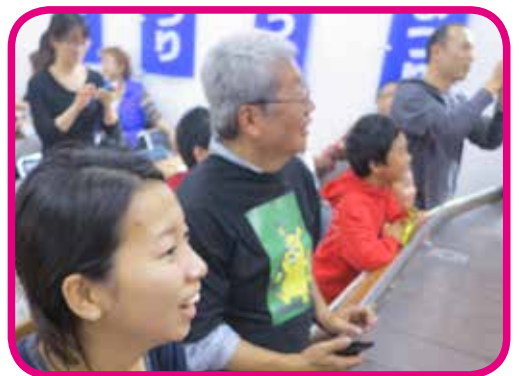
おとな子ども 大人も子供も きょうぎ だいせいえん 競技に大声援