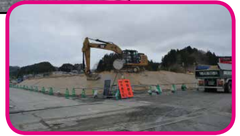
りくぜんたか だ 陸前高田の いっぽんまつ ふ きん 一本松付近