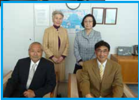
こくさいこうりゆうききようかい 国際交流協会 しゃしんした （写真下）