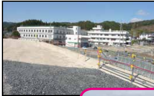
やまだまち かさあ 山田町の嵩上げ こうじ 工事