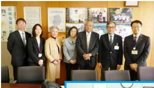
けんかんききようせいいかつ ぶ 県環境生活部の みな しゃしんうえ 皆さんと（写真上）