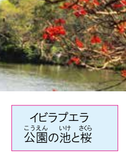
イピラプエラ公園の池と桜